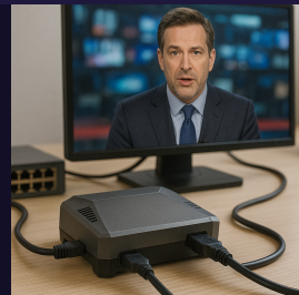
Imagen fuera de aire profesional

Configura URL, protocolo, volumen y modo de operación desde una interfaz web local protegida.